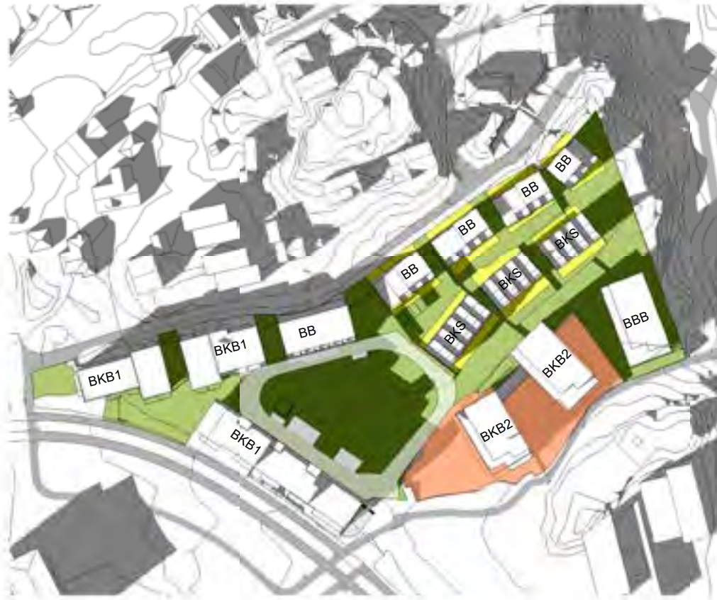
Sol vårjevdøgn kl17.