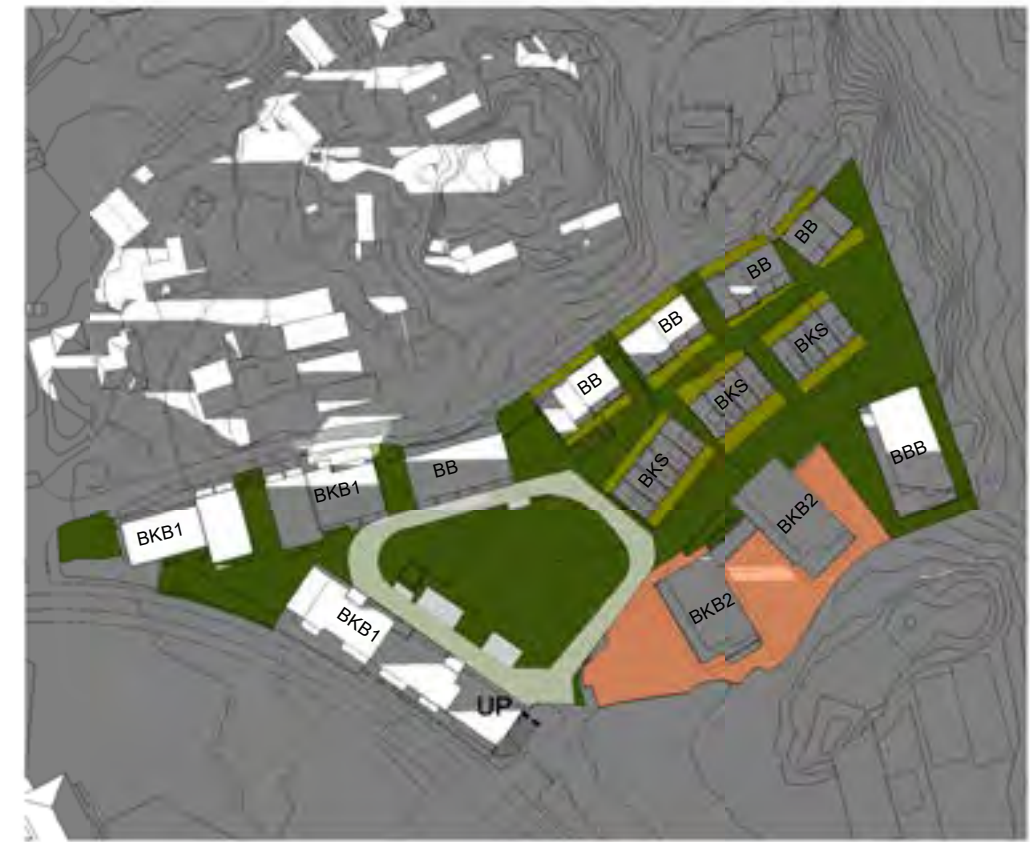
Sol vårjevdøgn kl20.