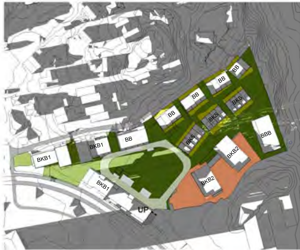
Sol vårjevdøgn kl19.