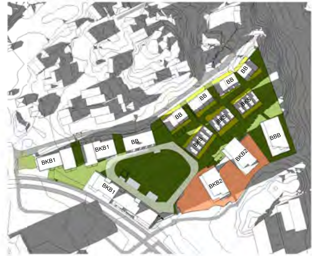
Sol vårjevdøgn kl18.