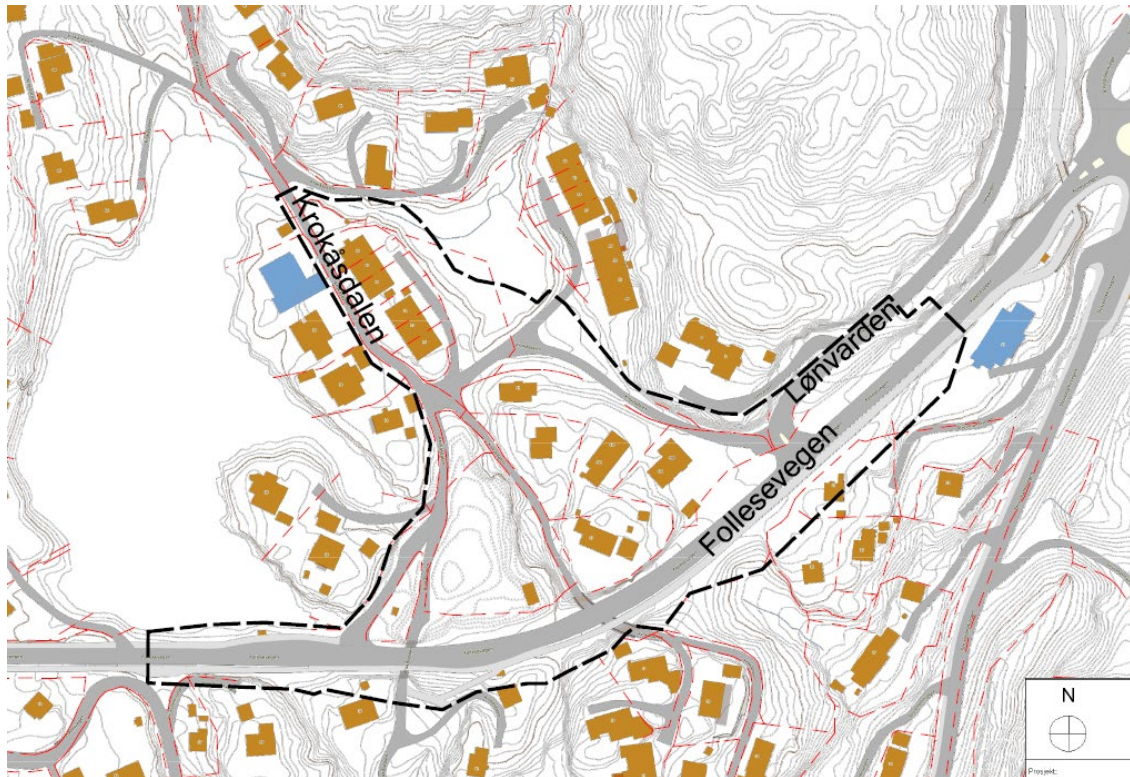
Figur 1. Varselkart